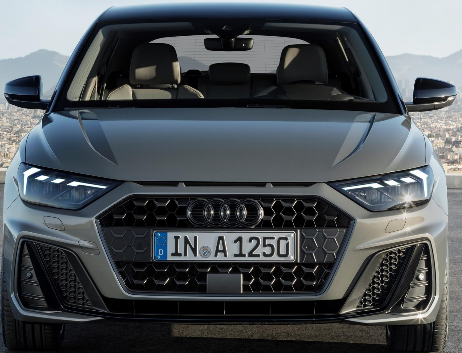
Abbildung zeigt Fahrzeug des Produktionsjahrs 2018 mit optionaler Sonderausstattung

* Audi A1 Sportback 25 TFSI, Schaltgetriebe, 70 kW: Kraftstoffverbrauch kombiniert: 4,8-4,7 l/100 km (NEFZ) bzw. 5,9-5,5 l/100 km (WLTP) ; CO 2 -Emissionen kombiniert: 111-107 g/km (NEFZ) bzw. 134-124 g/km (WLTP)