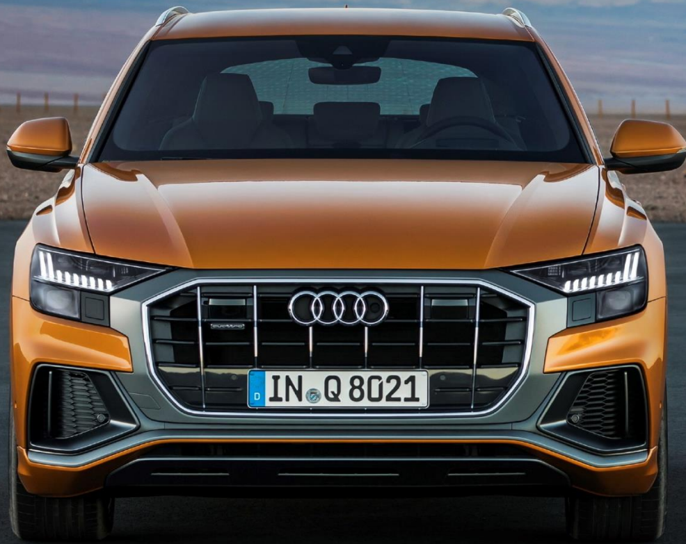
Abbildung zeigt Fahrzeug des Produktionsjahrs 2018 mit optionaler Sonderausstattung

* Audi Q8 50 TDI quattro tiptronic, 8-Gang tiptronic, 210 kW: Kraftstoffverbrauch kombiniert: 8,8-8,0 l/100 km (WLTP) ; CO 2 -Emissionen kombiniert: 231-210 g/km (WLTP)