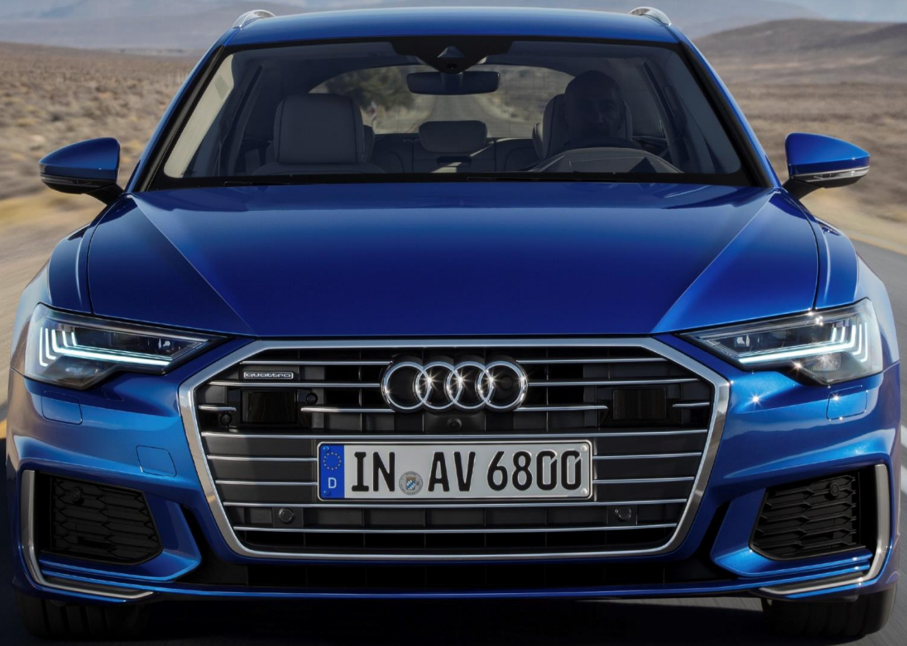
Abbildung zeigt Fahrzeug des Produktionsjahrs 2018 mit optionaler Sonderausstattung

* Audi A6 Avant 45 TFSI quattro S tronic, 7-Gang S tronic, 195 kW: Kraftstoffverbrauch (kombiniert): 8,5 - 7,6 l/100 km; CO 2 -Emissionen (kombiniert): 193 - 172 g/km; CO 2 -Klasse: G-F