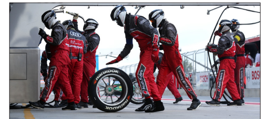
Branding in der Kategorie Funktionskleidung / Arbeitskleidung