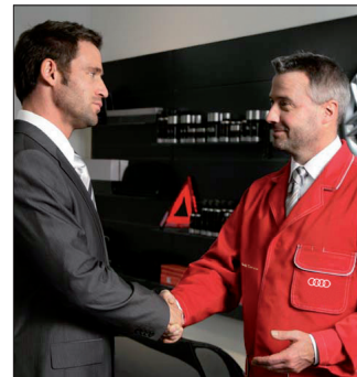
Funktionskleidung / Arbeitskleidung