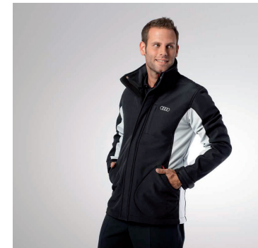
sportlich / casual