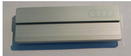
Branding in der Kategorie business / repräsentativ