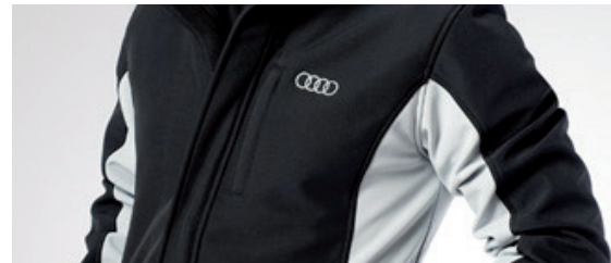
Branding in der Kategorie sportlich / casual